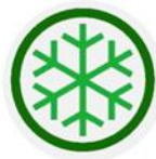
Gambar 3. Logo Fitofarmaka